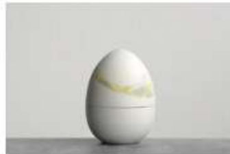
卵～ひよこ誕生 サイズ：Φ79×105mm