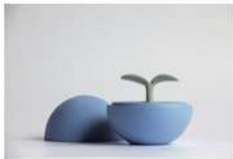
地球～芽吹き サイズ：Φ104×102mm

容器の中にアロマオイルを入れておくとスウェーデンでできたディフューザーがオイルを吸い上げ、香りを拡散させてくれます。香りを必要としない時は蓋をしておくことで、拡散を防ぐことができますし、オブジェとしてもお楽しみいただけます。