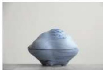
空～現われる雲 サイズ：127×78×94mm