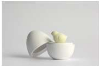
卵～ひよこ誕生 サイズ：Φ79×105mm