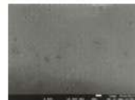
500倍顕微鏡写真 [陶磁器] 吸水率0.1%