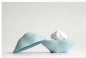
空～現われる雲 サイズ：127×78×94mm